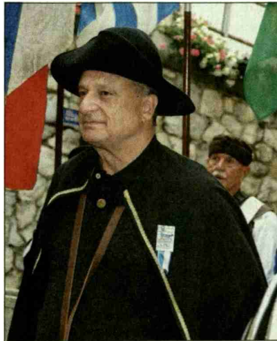
Zürcher Stadtrat Filippo Leutenegger