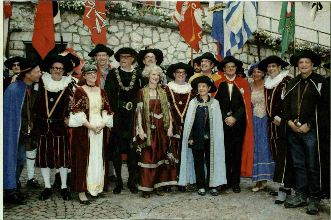
Vereint – die Regierung beider Städte

Themen-Nr.: 034.006 Abo-Nr.: 3003399 Seite: 11 Fläche: 116'093 mm 2