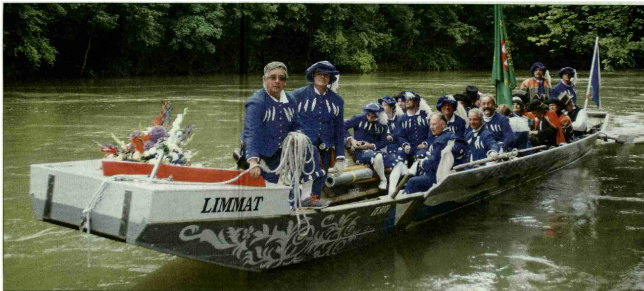
Ankunft am Limmat-Landesteg oberhalb des Kraftwerkes Aue, Baden

Vorzügen und Aktivitäten, welche Baden zu bieten habe, im Bilanz-Ranking vor Baden liege, wurde mit tosendem Beifall quittiert. Mit städtischen Landwirtschaftsprodukten und einer Hirsebreifahrtkanne 2016 bedankte sie sich für das Gastrecht. Später trafen sich Hirsebreifahrer, Zünfte und Stadträte im Bäderquartier zu Speis und Trank. Dabei wurden alte Freundschaften gepflegt und neue geschlossen. Leider mussten die Hirsebreifahrer dabei zur Kenntnis nehmen, dass der hohe Wasserstand der Limmat eine Weiterfahrt verunmöglichte. So wurden die Schiffe auf dem Landweg verschoben, um sie kurz vor Rheinfeldern, dem Etappenort, wieder zu wassern. ●