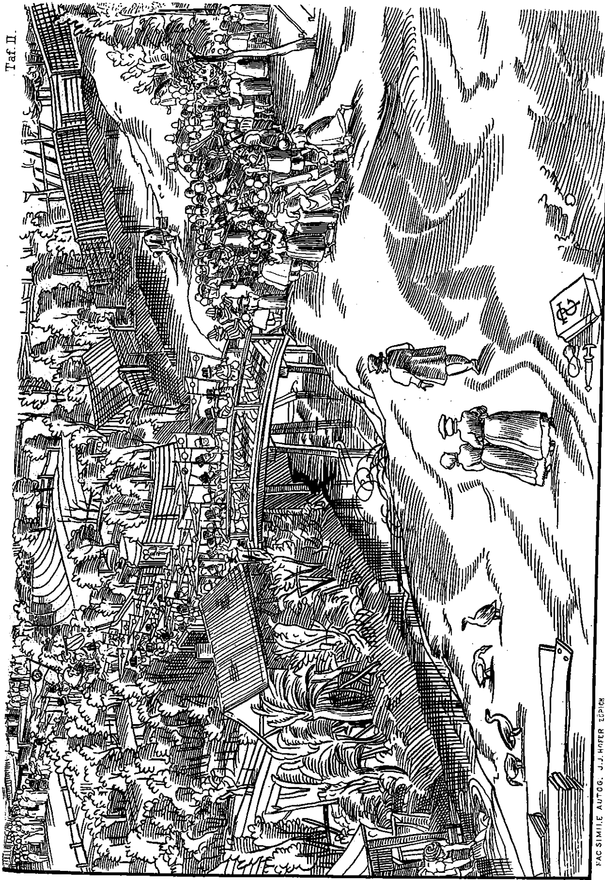
FAC SIMILE AUTOG. J. J. HOFER EÜRICH

Eigentliche Verzeichnus des berühmten Strasburgischen Hauptschießens mit dem Stachel oder Strupf / dieses gegenwärtige I. S. 76. Jar von dem römij. Kay / bis auf den Neunten Junij / samt dem Nachhauptschießen / alda glücklich volspracht und geendet / und nun gegenwärtiger gefalt inn truck gegeben und gefärtiget / durch Bernhart Jobin Burgern zu Strasburg